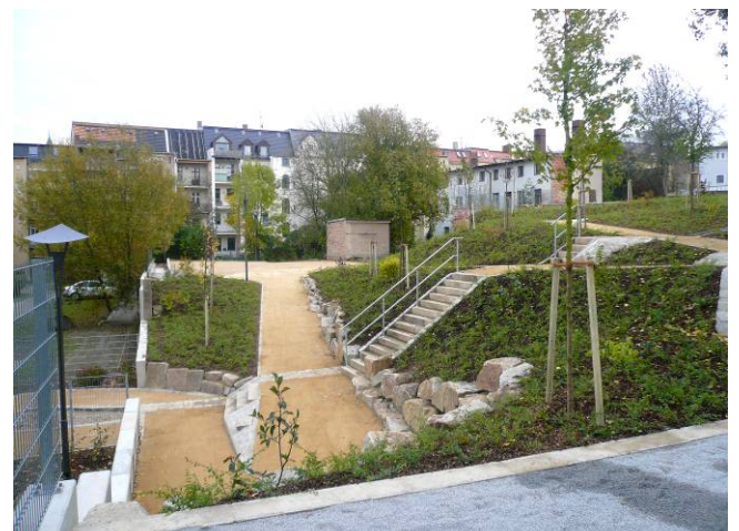
gemeinsamlich genutzte Wege durch das Quartier